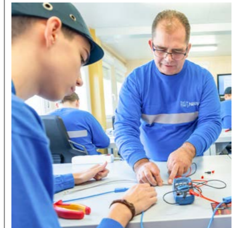
A duális szakképzés első évfolyama Szerencsen 2023-ban indult. Tanműhelyünkben jelenleg hat diák sajátítja el a villanyszerelő szakma alapjait.

Az üzem növekedése miatt folyamatosan keressük a megfelelő munkaerőt Szerencsen, de arra is kiemelt figyelmet fordítunk, hogy a jövő munkatársait is kiképezzük. A pályaválasztás előtt álló fiataloknak nagyszerű lehetőséget nyújt a duális képzési programunk, ami értékes munkatapasztalatokkal látja el az érdeklődőket, méghozzá modern környezetben, a gyár területén újonnan kialakított oktatási központban.